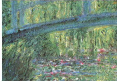
Lieu n°1 Entrée de Ville