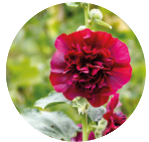
Lieu n°4 Château de la Celle