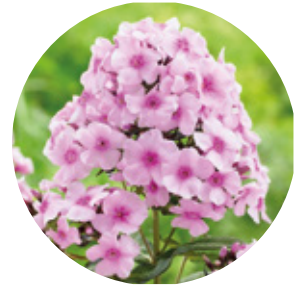
Lieu n°2 Place du Général Audran