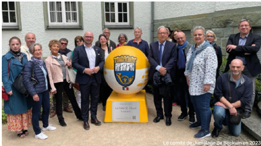
Le comité de Jumelage de Beckum en 2023

Cette dynamique témoigne d'une volonté commune : faire vivre une ville ouverte, solidaire et tournée vers l'Europe et le monde. La municipalité souhaite renforcer les jumelages existants afin de les rendre plus concrets, utiles et accessibles à tous. L'objectif est de développer des projets répondant aux