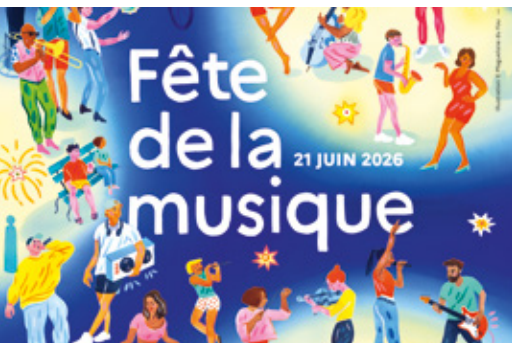
Les 20 et 21 juin, la Ville fête la musique à la médiathèque et place Berthet