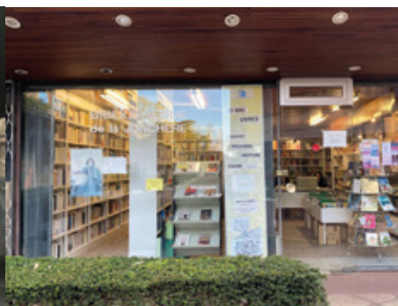
Braderie de la bibliothèque La Jonchère Élysée 2