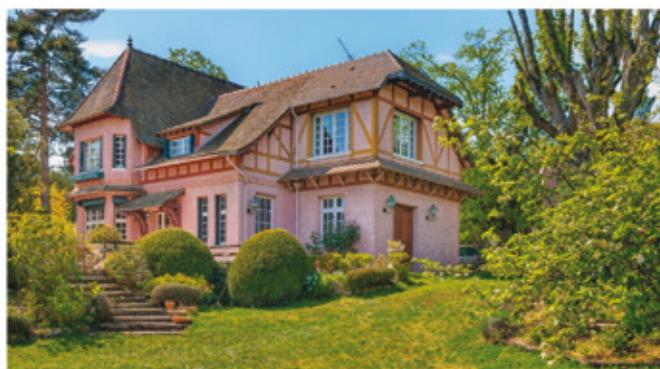
LES GRESSETS - Maison de 338 m 2 - 2 100 000 €