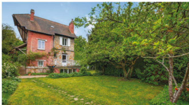
LA CHATAIGNERAIE - Maison de 180 m 2 - 910 000 €