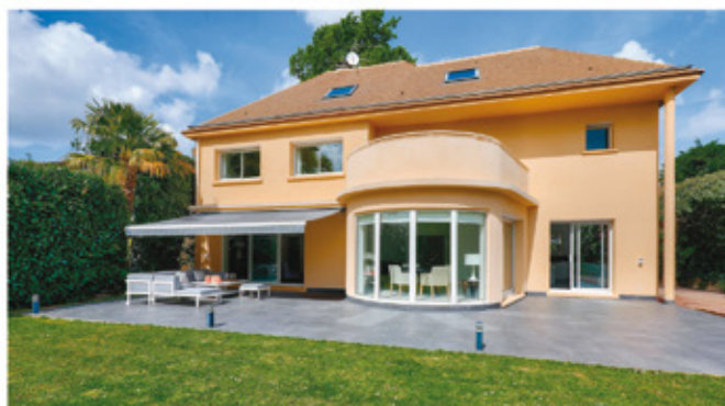
LA FEUILLAUME - Maison de 270 m 2 - 1 995 000 €