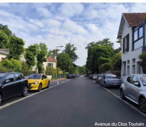
Avenue du Clos Toutain

Ces travaux consistent en l'installation de mobiliers, la création de divers talus et reliefs et la préparation de plantations pour l'automne.