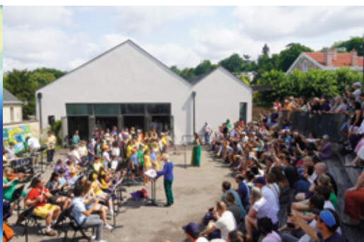
Les Rencontres du Carré des Arts