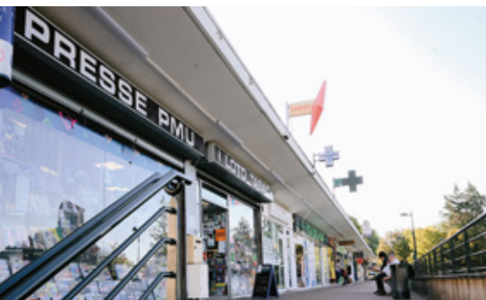
Changement de propriétaire du Tabac Presse Beauregard