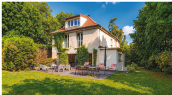
LA FEUILLAUME - 205 m 2 - 1 100 000 €