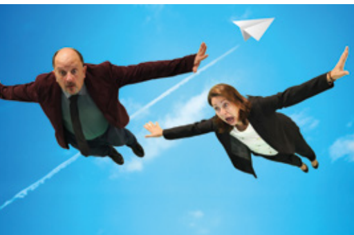
Pièce de théâtre Y a-t-il un pilote dans la salle ? à la Kab'-Mjc