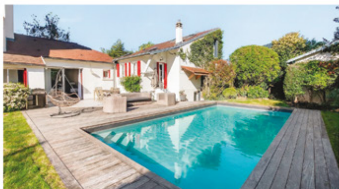
LA FEUILLAUME - Maison de 208 m 2 - 1 600 000 €