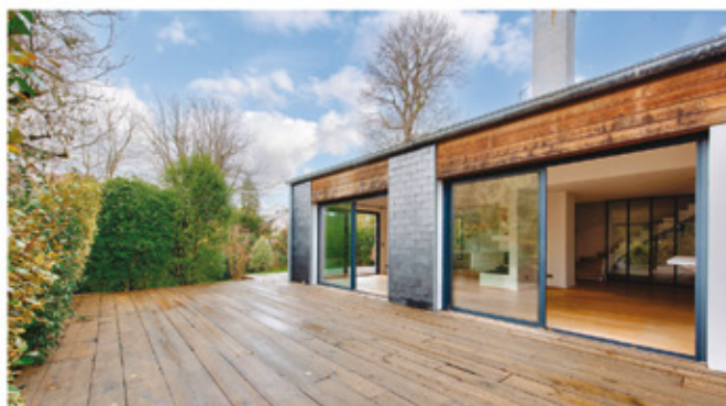
LA FEUILLAUME - Maison de 250 m 2 - 1 790 000 €