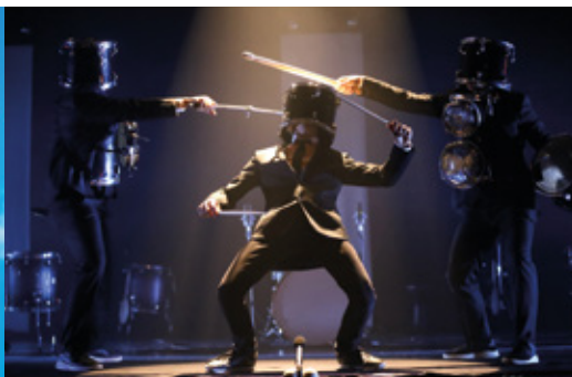
Drum Brothers , au Théâtre