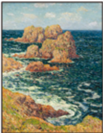
Adjugé 115 000 €

Château du Domaine Saint François d'Assise - 53 Av. de la Jonchère Les lundis 15 juin, 14 septembre 2026 sur rendez-vous en juillet à votre domicile après un premier avis sur photo