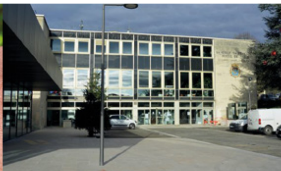
La Ville recrute, consultez les offres d'emploi sur le site laclesaintcloud.fr