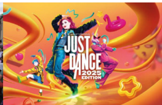
Animation jeu vidéo "Just dance" à la médiathèque