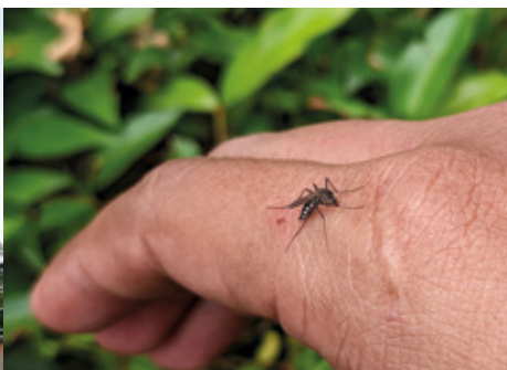
Gestes préventifs contre le moustique tigre