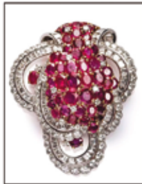
CARTIER - Adjugé 67 000 €