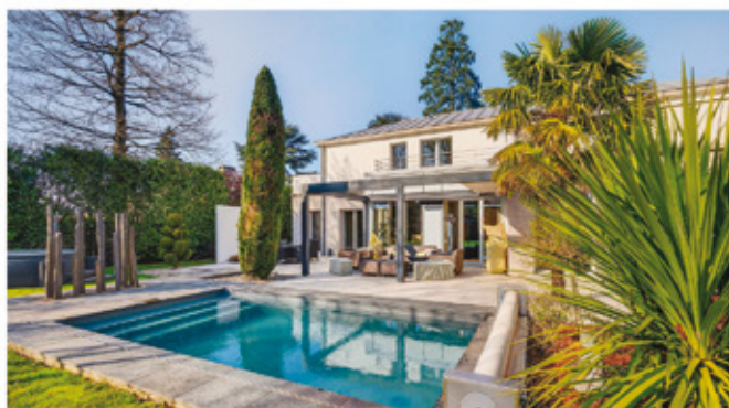
LA FEUILLAUME - Maison de 252 m 2 - 2 350 000 €