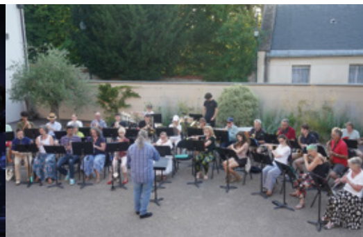
Concert des musiciens du Carré des Arts pour la Fête de la musique