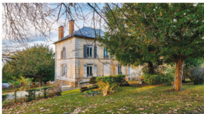
LE BOURG - Maison de 271 m 2 - 2 480 000 €