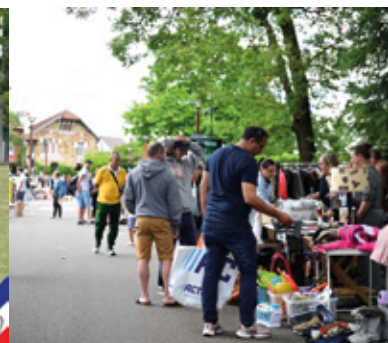
Vide grenier de la Feuillaume