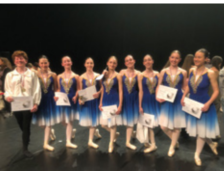
Les élèves de Danse et vie celloise ont participé au concours Petits pas à Vélizy-Villacoublay