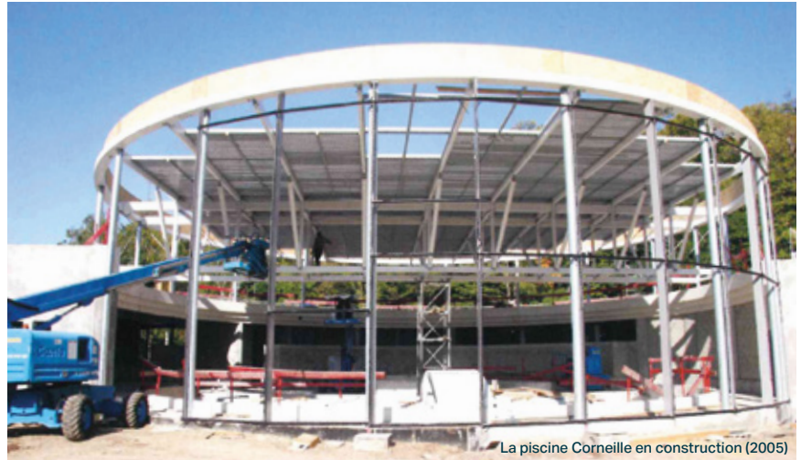
La piscine Corneille en construction (2005)

Au fil des années, certains moments ont marqué la vie de l'équipement. « Lors de la première animation avec structure gonflable en 2008, nous avons été obligés de rester à cheval sur le haut du toboggan pour aider les enfants à monter », se souvient-il. En 2015, un record de fréquentation est atteint avec 1 167 entrées en