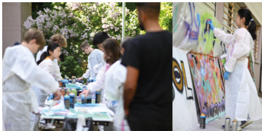
▲ Stage de street art à la Kab'-Mjc