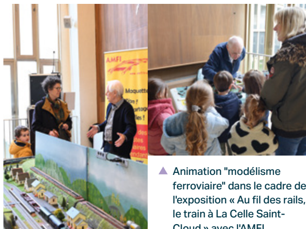
▲ Animation "modélisme ferroviaire" dans le cadre de l'exposition « Au fil des rails, le train à La Celle Saint-Cloud » avec l'AMFI