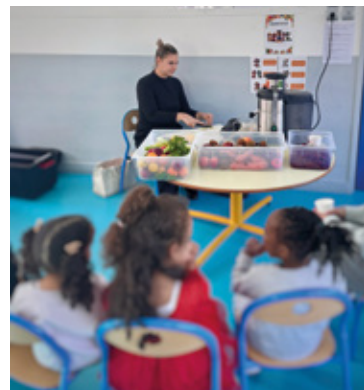
▲ Animation bar à jus au restaurant scolaire de l'école maternelle Jules Ferry