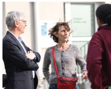
▲ Présentation du projet de street art de l'artiste Alix Anselme dans le quartier de Beauregard