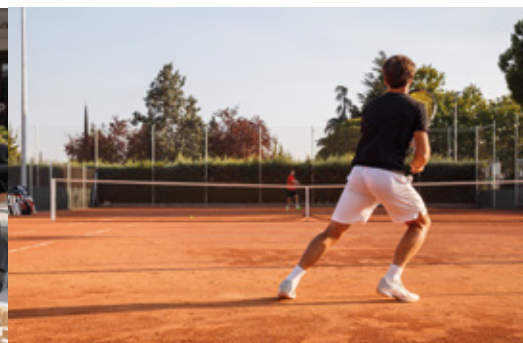
Le Tennis Club propose différentes formules pour le printemps et l'été