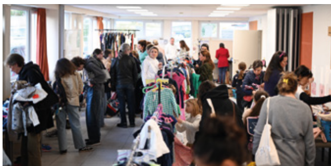
▲ Braderie de l'association AFC