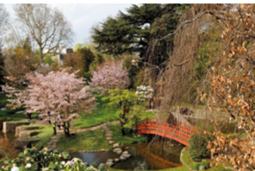
Visite du musée et du jardin Albert Kahn avec les Randonnées amicales