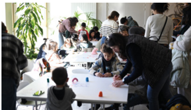
▲ Animation "Ciné Pitchoun" au Cinéma : projection d'un film jeune public, petit déjeuner et atelier