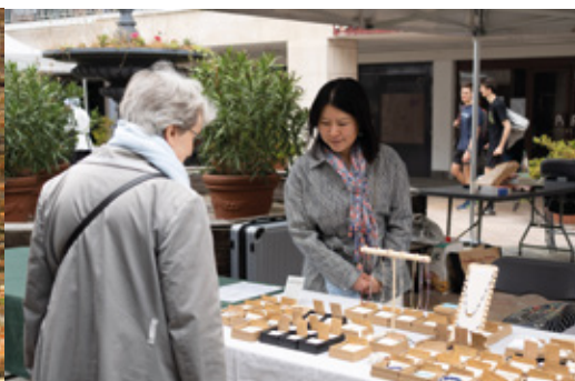
Marché spécial Fête des mères et des pères au centre commercial Élysée 2