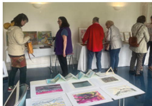
◀ Portes ouvertes des ateliers d'artistes cellois