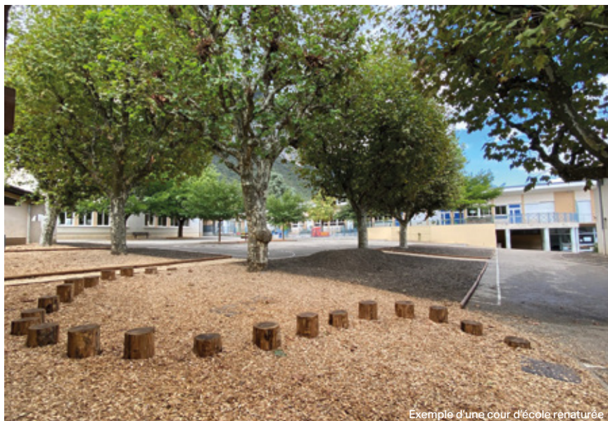
Exemple d'une cour d'école renaturée