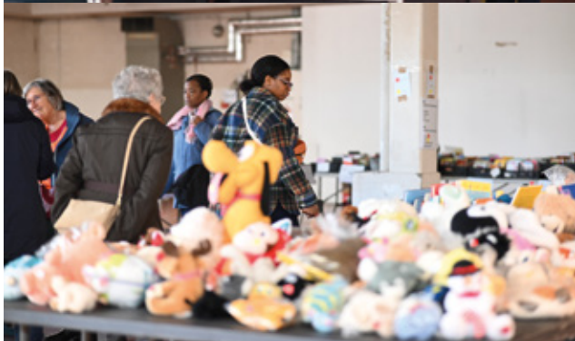
▲ Braderie de la Croix-Rouge