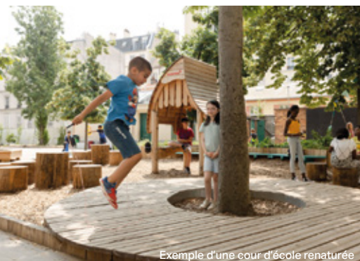
Exemple d'une cour d'école renaturée

La cour sera également repensée pour enrichir les usages et offrir des espaces variés : terrains de sport (basket, piste de course), jeux au sol (marelles), structures ludiques (cabanes, huttes), ainsi que du mobilier convivial (gradins, bancs, tables de pique-nique). À travers ce projet, la Ville confirme sa volonté de faire évoluer les cours d'école en véritables espaces de vie, plus verts, plus durables et mieux adaptés aux défis environnementaux.