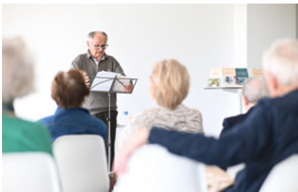
▲ "Une heure, un auteur" : lecture à voix haute du dernier livre de Marie Nimier à la médiathèque