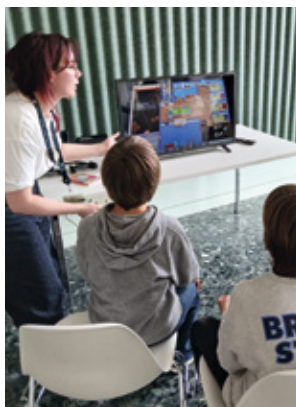
▲ Animation jeux vidéo à la médiathèque