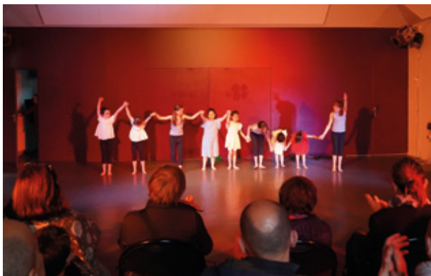
▲ Spectacle de danse des jeunes élèves du Carré des Arts