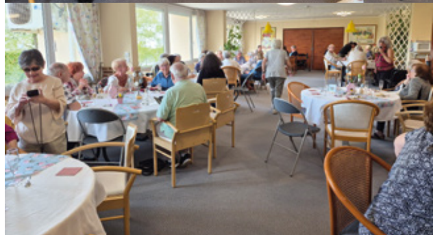
▲ Goûter de Pâques de la Résidence Renaissance