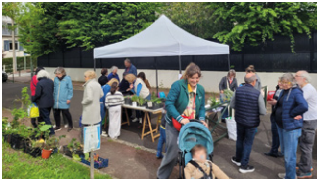
▲ Troc aux plantes de la Châtaigneraie