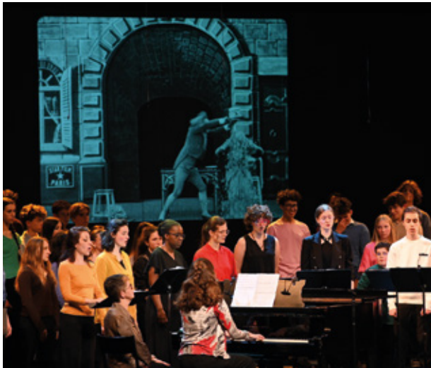
▲ Festival Choeurs en fête