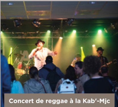
Concert de reggae à la Kab'-Mjc