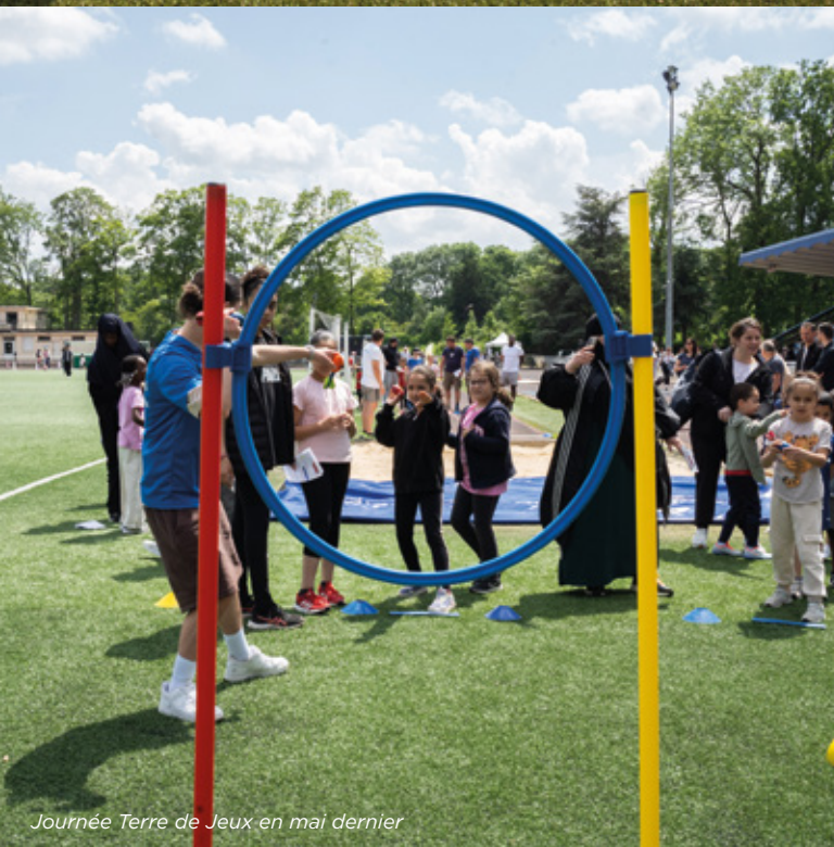
Journée Terre de Jeux en mai dernier