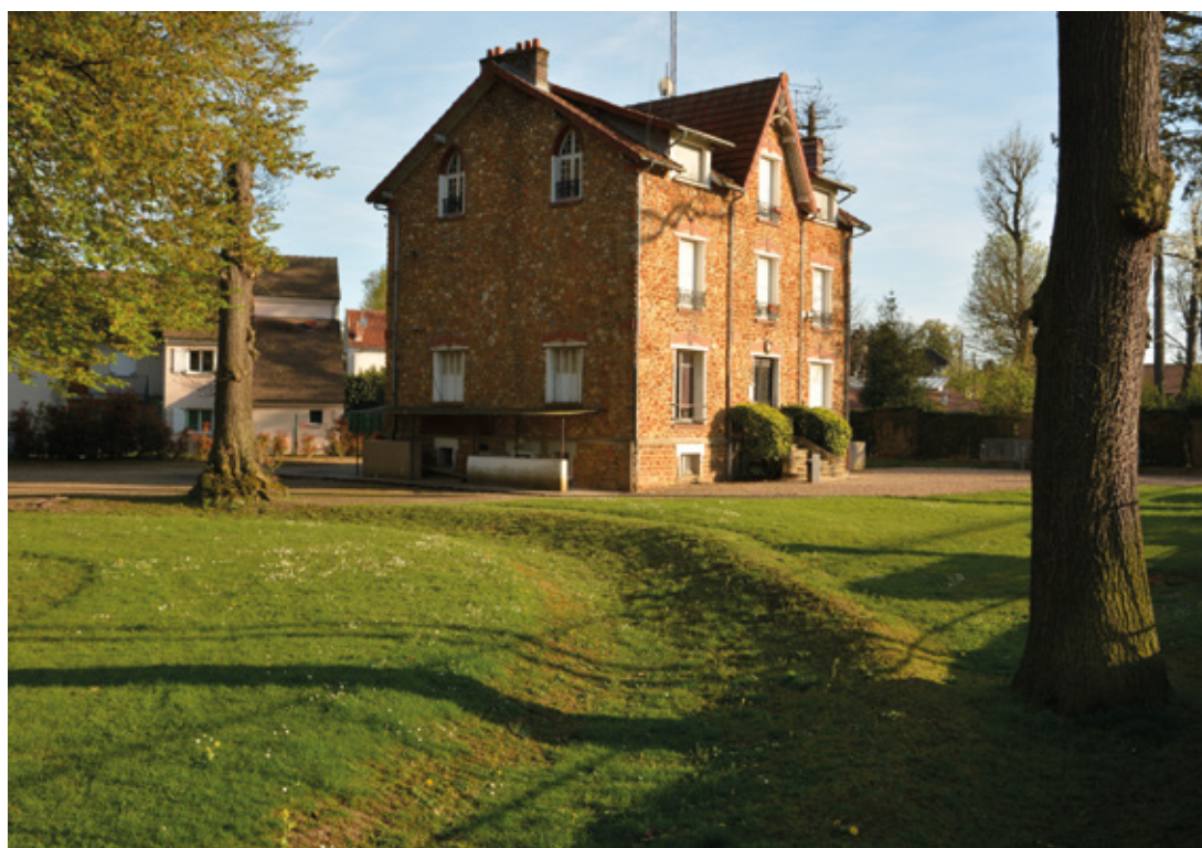
Villa Guibert et sa piste de nos jours

À l'occasion des Journées Européennes du Patrimoine des 21 et 22 septembre 2024, la Villa Guibert sera ouverte au public avec une exposition et deux mini-conférences. Plus de détails dans le Cellois Infos de septembre.