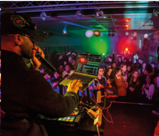
Soirée jeunes 11/15 ans à la Kab'-Mjc