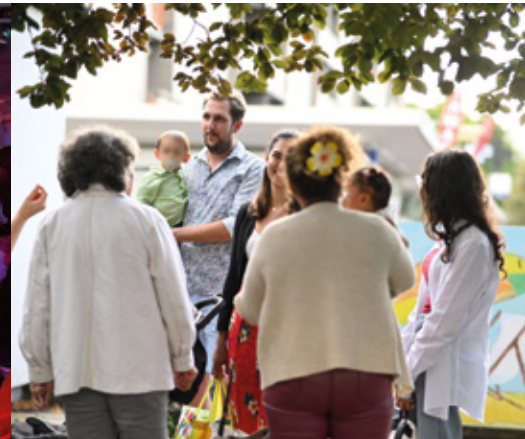
Terrasses d'été à l'Espace André Joly