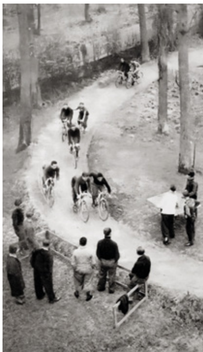
La plus petite piste de France