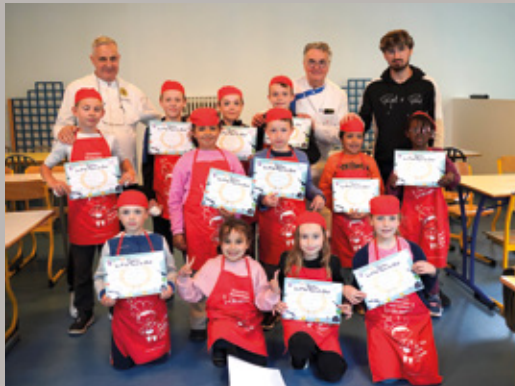
"Les Petits Toqués du goût", avec les élèves de l'accueil de loisirs élémentaire Louis Pasteur, en lien avec le service restauration et les cuisiniers de la restauration scolaire