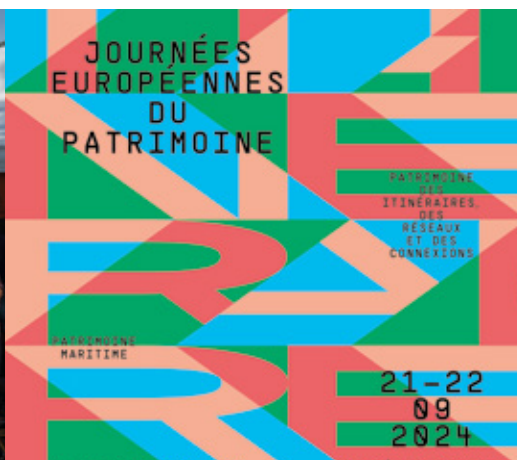
41 ème édition des Journées européennes du patrimoine