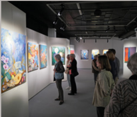
Vernissage de l'exposition "Autoportrait métaphorique", par les ateliers de peinture du Carré des Arts