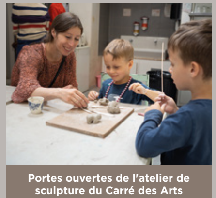
Portes ouvertes de l'atelier de sculpture du Carré des Arts