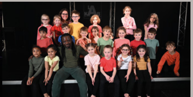
Restitutions des projets artistiques et culturels par deux classes des écoles Dunant et Curie sur la scène de la Kab'-Mjc