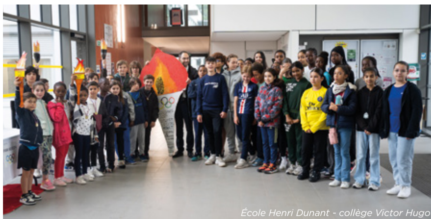
École Henri Dunant - collège Victor Hugo

Pour vivre et faire vivre les JOP dans les écoles de notre circonscription et célébrer le retour des