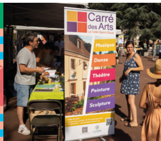
Ouverture des inscriptions au Carré des Arts à partir du 2 septembre