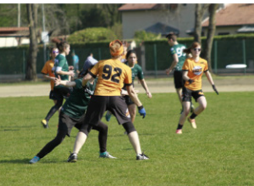
Tournoi d'Ultimate et activités découverte au stade L.R. Duchesne