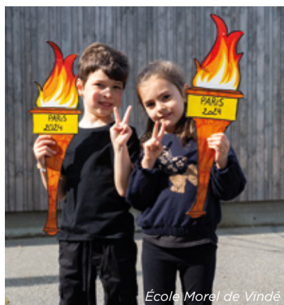
École Morel de Vindé