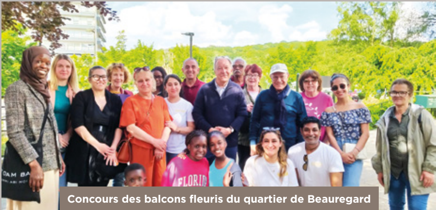
Concours des balcons fleuris du quartier de Beauregard