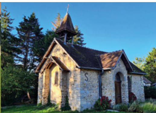
L'association Etincelle propose plusieurs "Randonnées amicales" au mois de juillet