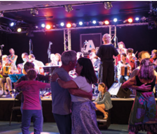
P'tit bal d'été à la Kab'-Mjc