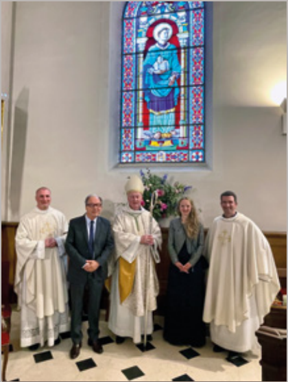
Une inauguration du nouveau vitrail de l'église Saint-Pierre - Saint-Paul, en présence de l'Evêque Luc Crépy, du Maire, du Conseil Municipal, du Père Wanan et de la paroisse de La Celle Saint-Cloud