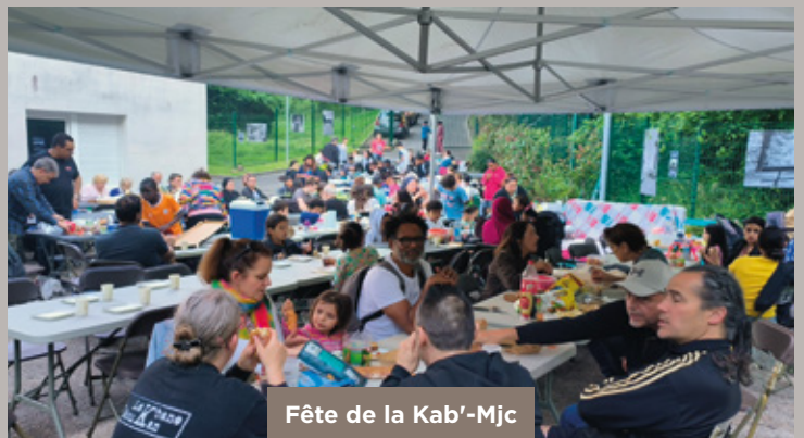
Fête de la Kab'-Mjc