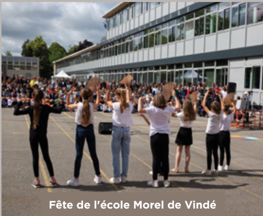
Fête de l'école Morel de Vindé