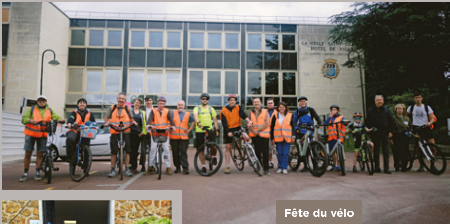
Fête du vélo