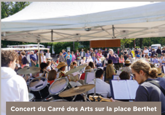
Concert du Carré des Arts sur la place Berthet