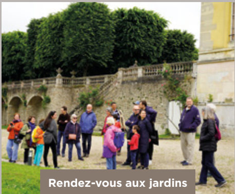
Rendez-vous aux jardins