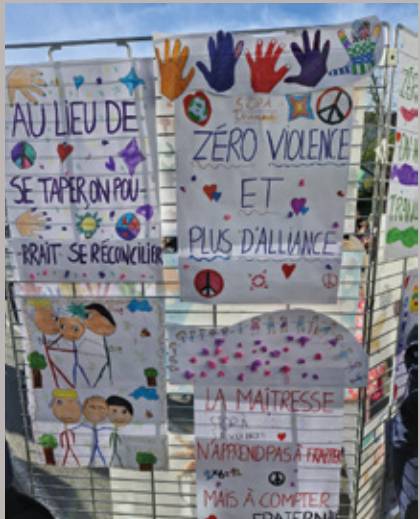
Exposition des travaux du projet d'école Pierre et Marie Curie élémentaire "Tolérance 0 violence à l'école", lors d'un petit déjeuner parents/ enfants/ enseignants