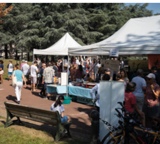
Journée des associations le 8 septembre au Parc de La Grande Terre