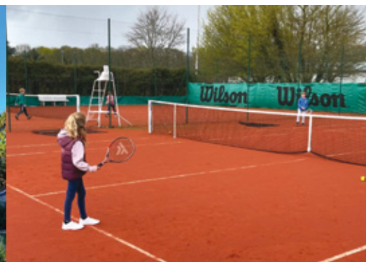
Les courts de tennis restent ouverts cet été pour les adhérents