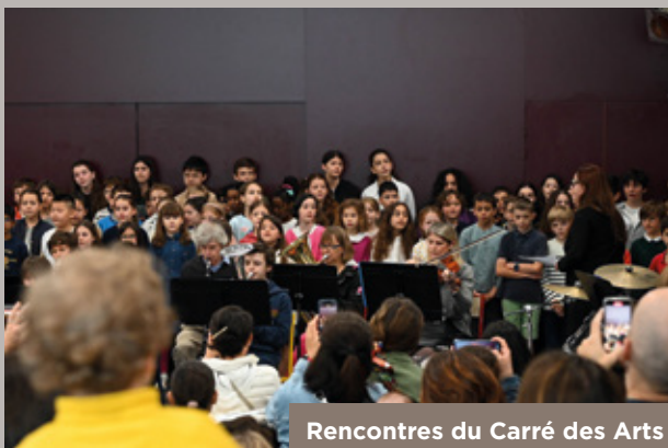
Rencontres du Carré des Arts