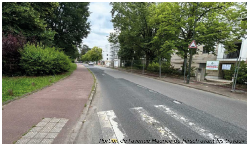
Portion de l'avenue Maurice de Hirsch avant les travaux

Votée lors du budget primitif, la suite des travaux de l'avenue Maurice de Hirsch sera réalisée cet été. Des portions des avenues Lyautey, du Chesnay, de la rue de Vindé et des trottoirs de l'avenue Duchesne feront, quant à elles, peau neuve grâce au budget supplémentaire adopté lors du conseil municipal du 17 juin dernier. Les services techniques ont également programmé la réfection des marquages de la voirie communale.