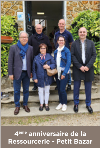
4 ème anniversaire de la Ressourcerie - Petit Bazar