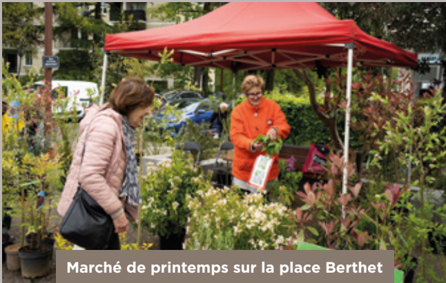
Marché de printemps sur la place Berthet