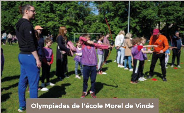
Olympiades de l'école Morel de Vindé