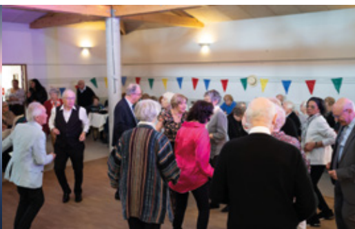
Le goûter dansant des seniors au Pavillon des Bois Blancs