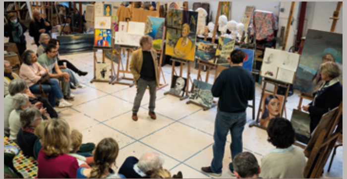
Présentation des dessins et peintures des élèves du Carré des Arts