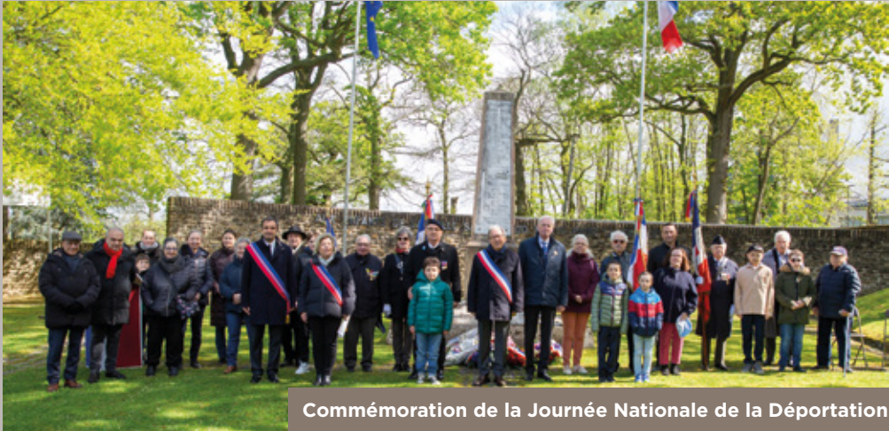
Commémoration de la Journée Nationale de la Déportation