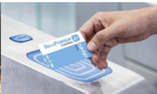
Nouveau : le passe Navigo easy