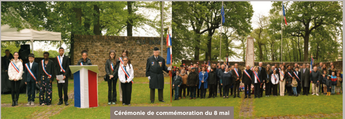
Cérémonie de commémoration du 8 mai