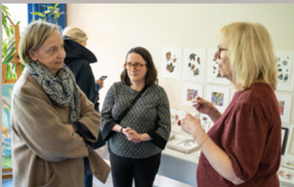
Journées "Portes ouvertes d'ateliers d'artistes"