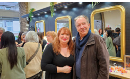
Le salon « Saint Lou coiffure » devient le « Salon by Nath »