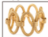
Adjugé 17 500€