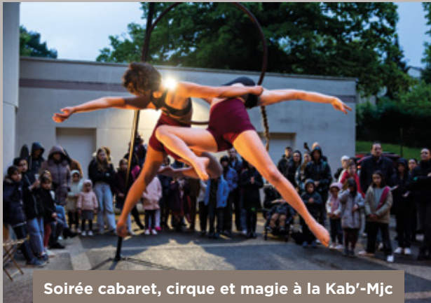
Soirée cabaret, cirque et magie à la Kab'-Mjc