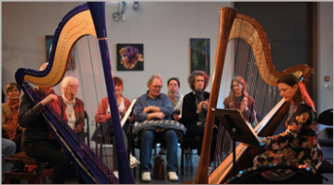
Concert de harpes electro et acoustique au Carré des Arts