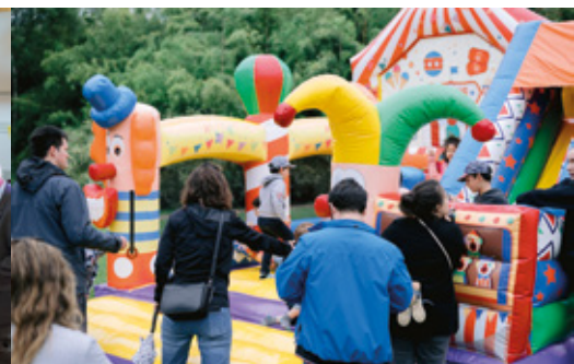
Fêtes de la Ville le samedi 29 juin