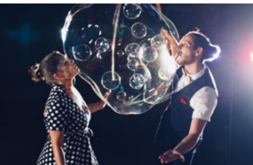
Les Magiciens des bulles, au Théâtre