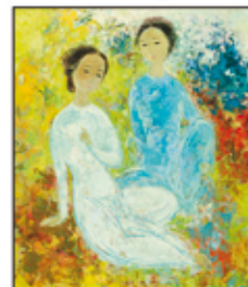
Vietnam - Adjugé 30 000€