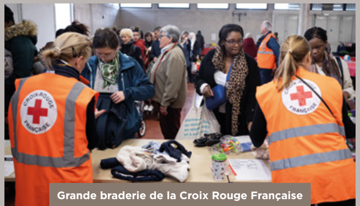
Grande braderie de la Croix Rouge Française