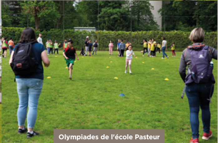
Olympiades de l'école Pasteur