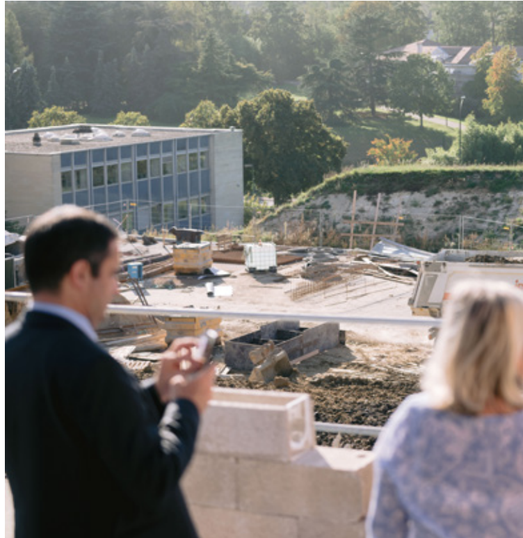
Pose de la première pierre de la Médiathèque, octobre 2023.

Le Budget primitif de la Ville a été voté lors du Conseil municipal du 19 décembre dernier, après une année 2023 dont le contexte reste marqué par la hausse très forte du coût des énergies (électricité, gaz, essence), la hausse générale des prix et les incertitudes liées au contexte international et au déficit budgétaire de l'Etat. Malgré ce contexte incertain, notre Ville, grâce à son choix volontaire de stabilité des taux et de maintien d'un auto-financement élevé et à l'optimisation des dépenses publiques, propose un budget permettant d'accueillir avec sérénité, les grands projets à venir que sont la construction de la médiathèque, la réalisation du Cœur de Ville, la poursuite de la rénovation du Carré des Arts et la requalification du quartier de Beauregard (Cellois Infos n°86).