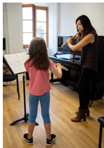
Une salle du Carré des Arts rénovée.