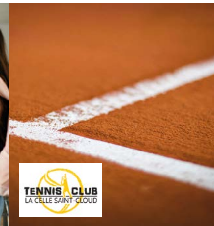
Le Tennis club dispose désormais de 2 courts "terre battue tout temps"