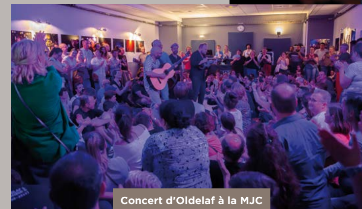
Concert d'Oldelaf à la MJC