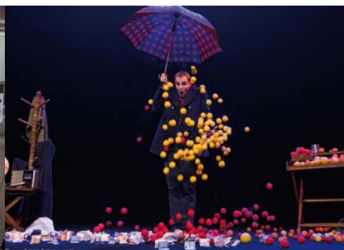
13 Rue du Hasard, au Théâtre