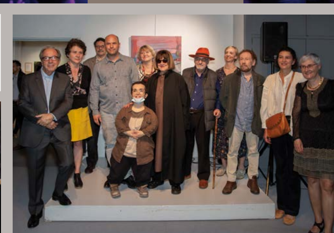
Vernissage de l'exposition "La nuit et le jour (ombres et lumières)", par le Carré des Arts