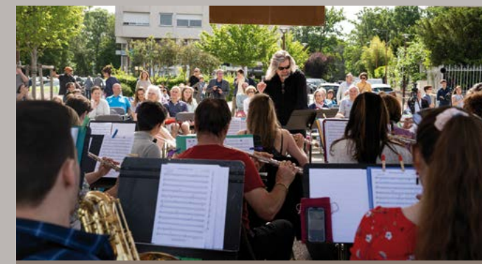
Concert du Carré des Arts sur la place Berthet