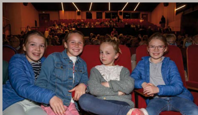
Opérette "L'Auberge du cou tordu" au Théâtre, présentée par le Carré des Arts