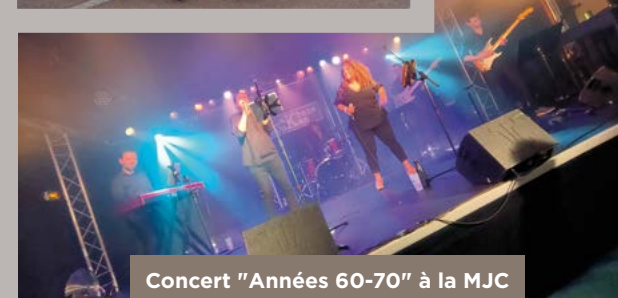
Concert "Années 60-70" à la MJC