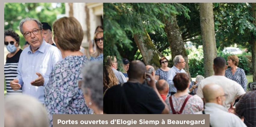
Portes ouvertes d'Elogie Siemp à Beauregard