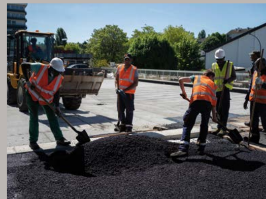
Les travaux de la dalle Caravelle se poursuivent