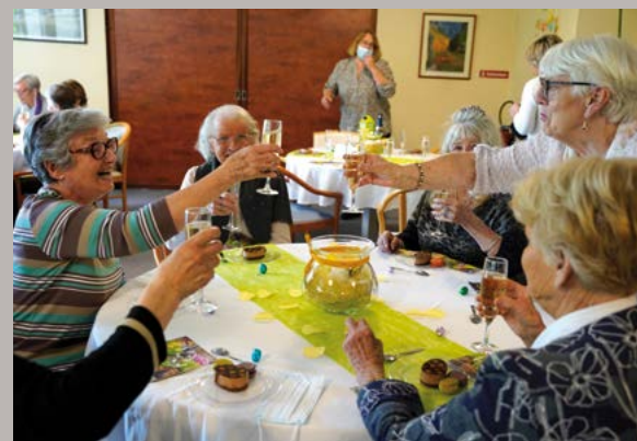
Déjeuner de Pâques à la Résidence Renaissance