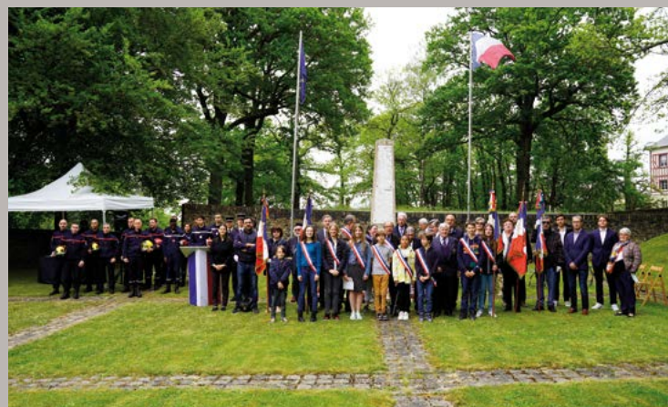
Commémoration de la victoire du 8 mai 1945