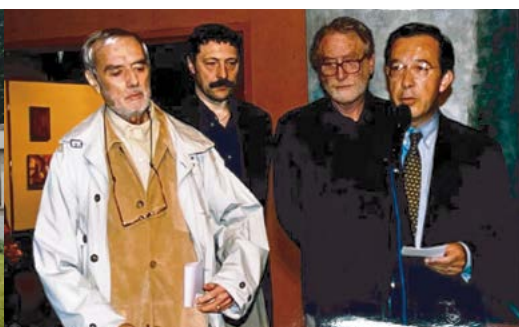
Vernissage de l'exposition de l'atelier de peinture de l'ASSARTX, 1999