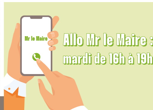
Une permanence se tient à l'Espace André Joly