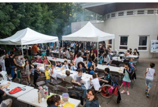
Fête de la MJC le 11 juin