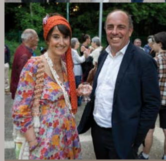
Inauguration des "60 ans de la MJC"