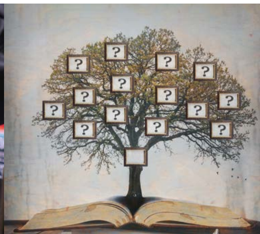
Le Cercle généalogique se réunit une fois par mois à l'Espace Jonchère