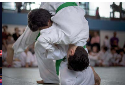
Fête du judo