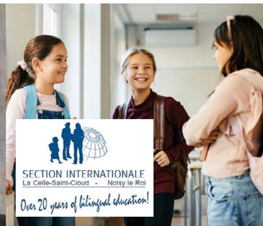
Cours d'anglais pour les enfants non-bilingues de 7 à 10 ans