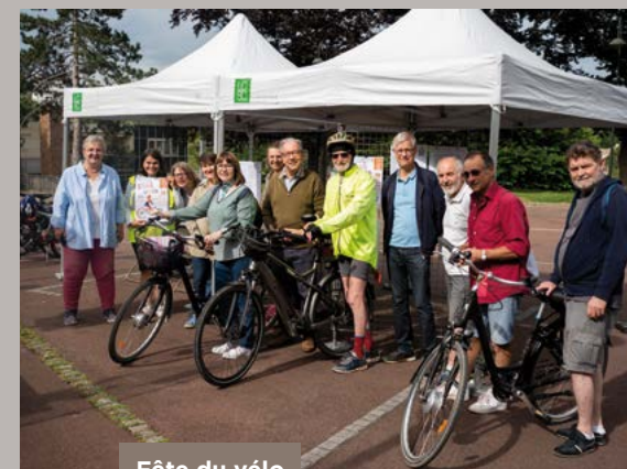
Fête du vélo