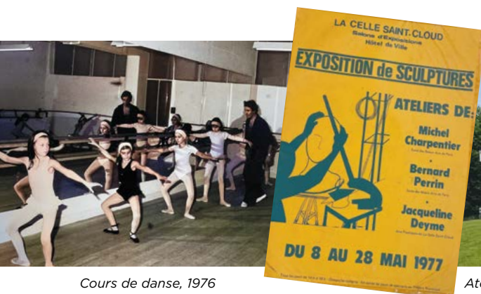
Cours de danse, 1976

Décembre 1971 : pleine réussite pour la création du conservatoire de musique et de danse de La Celle Saint-Cloud grâce à l'enthousiasme de Michel Quéval et aux qualités pédagogiques et professionnelles de ses professeurs. Le développement rapide de la structure a conduit la ville à reporter l'ouverture du département Beaux-Arts à la fin de l'année 1971.