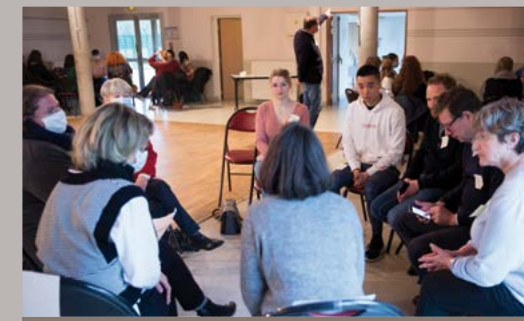
Réunion du groupe Espoir à l'Espace André Joly