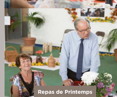
Repas de Printemps