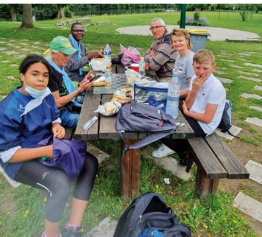
Les "randonnées amicales" avec l'association Étincelle