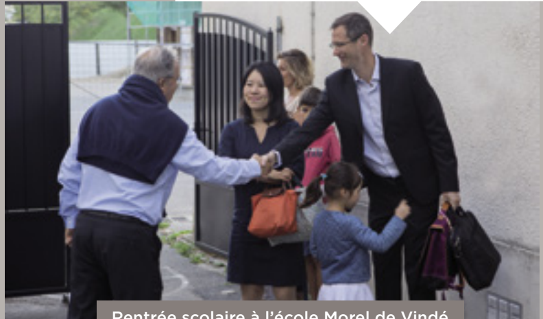
Rentrée scolaire à l'école Morel de Vindé