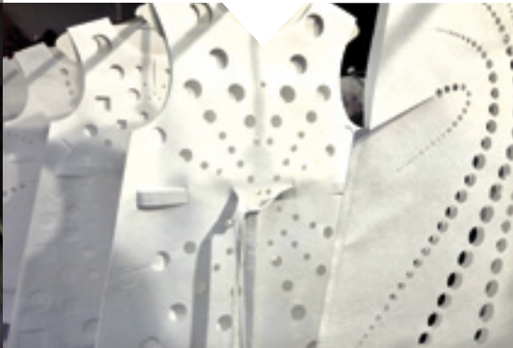
Exposition « Papier à fleur de peau »