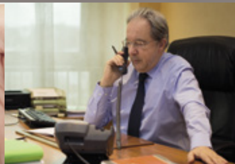
Allo Mr le Maire : mardis de 16h à 20h