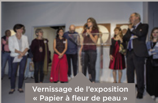
Vernissage de l'exposition « Papier à fleur de peau »