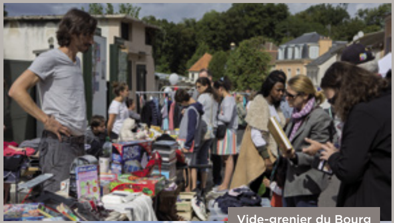
Vide-grenier du Bourg