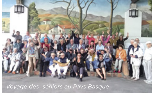
Voyage des seniors au Pays Basque