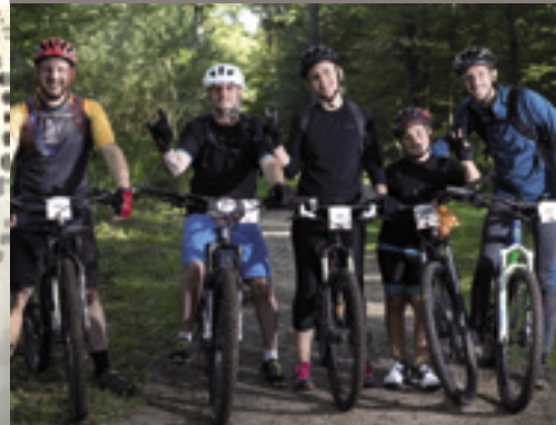
VTT Grand 8 Cellois