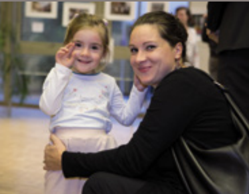
Accueil des nouveaux arrivants