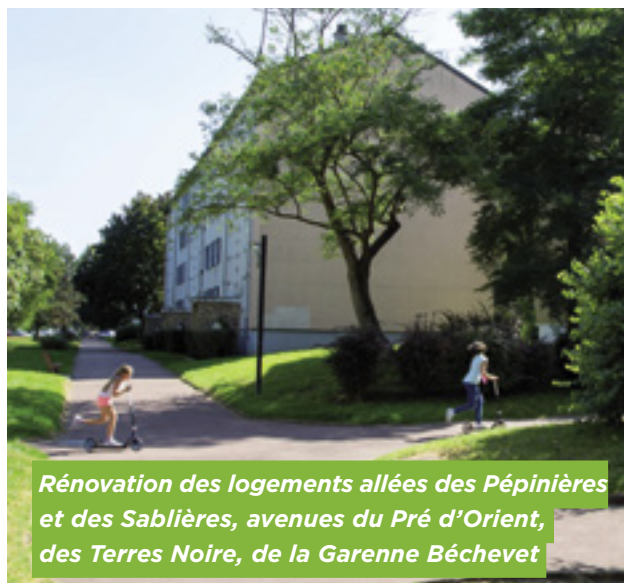
Rénovation des logements allées des Pépinières et des Sablières, avenues du Pré d'Orient, des Terres Noire, de la Garenne Béchevet

La région Ile-de-France vient de lancer son système Véligo Location. Pour 40€ par mois, elle met à disposition des vélos à assistance électrique avec un contrat de 6 mois au maximum. Le système est très simple : réservez votre vélo sur le site www.veligo-location.fr et retirez-le sur un des points de retrait proposés par Véligo. Le plus proche est le magasin Décathlon de Parly 2 où vous pouvez vous rendre aisément en empruntant la ligne de bus N° 2 ou la ligne D. Ces 6 mois sont une durée suffisante pour vérifier les avantages apportés par ce mode de déplacement doux. Libre à vous de poursuivre ensuite l'expérience en achetant un vélo électrique. Rappel : Véligo, c'est aussi une offre de stationnement Vélo sécurisé en test à la gare de La Celle Saint-Cloud accessible à tout détenteur d'une carte Navigo ayant pris un abonnement annuel (20€ par an).