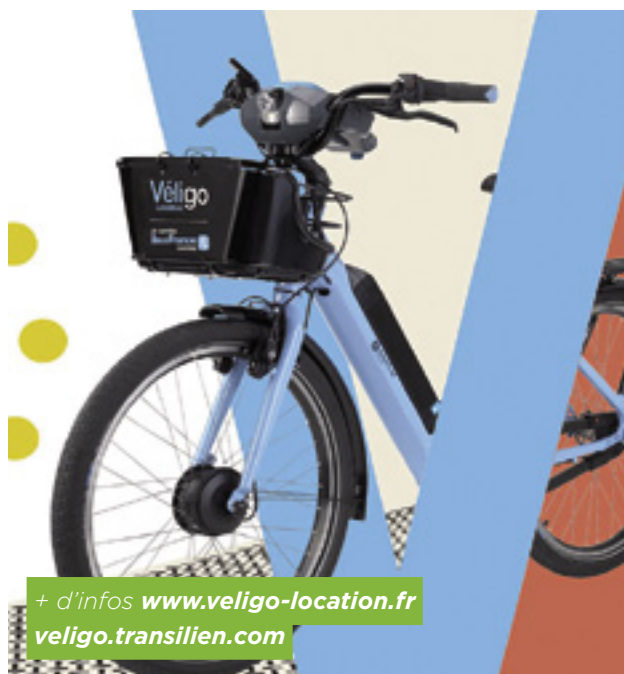
+ d'infos www.veligo-location.fr veligo.transilien.com

Dans le cadre de son Schéma Directeur Circulations Douces, la ville va réaliser cet automne un important tronçon de l'axe Collège Pasteur/Elysée 2. Une section « Voie centrale banalisée » sur le modèle de l'avenue Corneille sera mise en place sur l'avenue de Circourt entre le collège et l'avenue des Puits. Les bandes cyclables existantes sur la chaussée de l'avenue de la Jonchère au départ de la place Berthet seront poursuivies par une piste cyclable sur chacun des trottoirs jusqu'à l'entrée du Domaine Saint-François d'Assise où le relais sera pris par une voie verte bidirectionnelle sur le trottoir gauche jusqu'au carrefour avec l'avenue des Combattants.