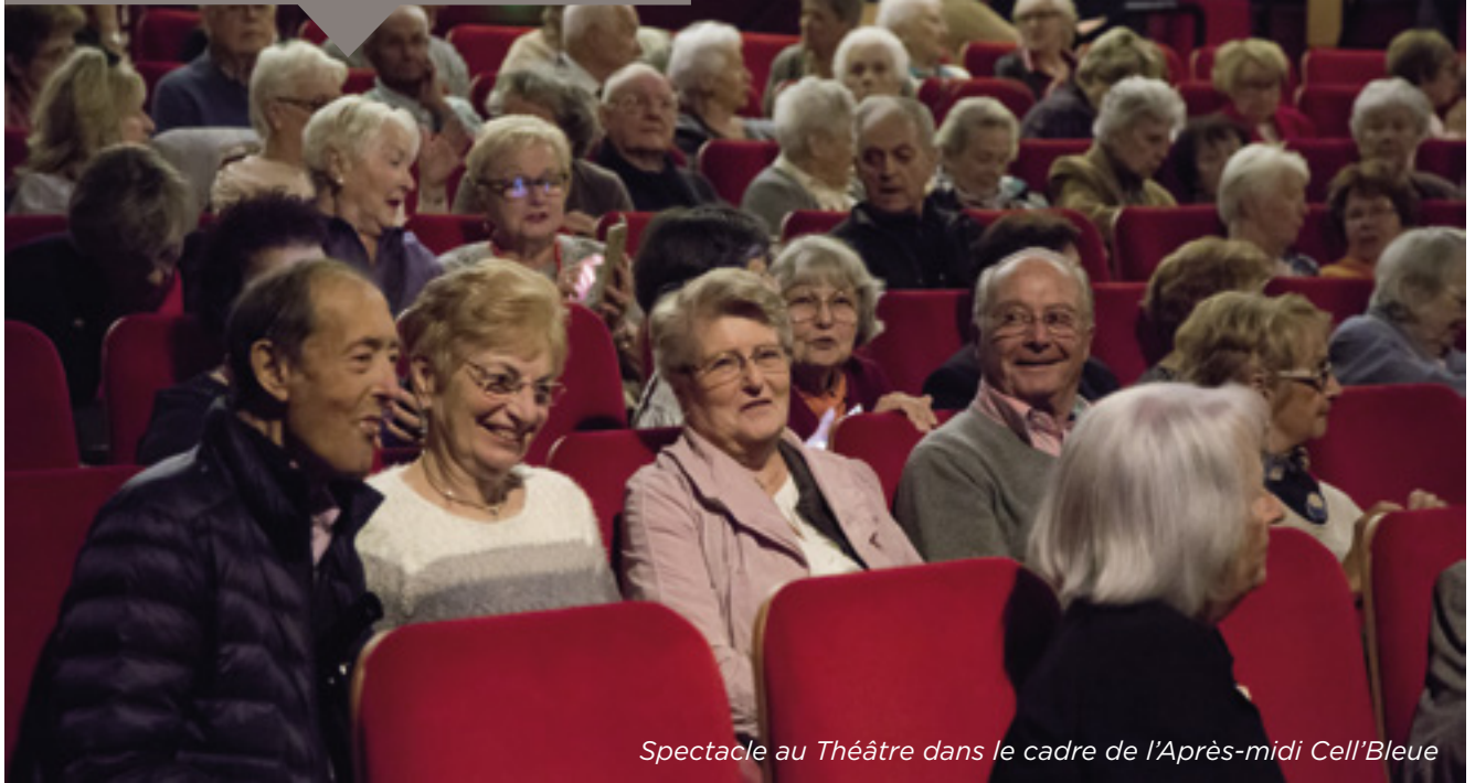
Spectacle au Théâtre dans le cadre de l'Après-midi Cell'Bleue