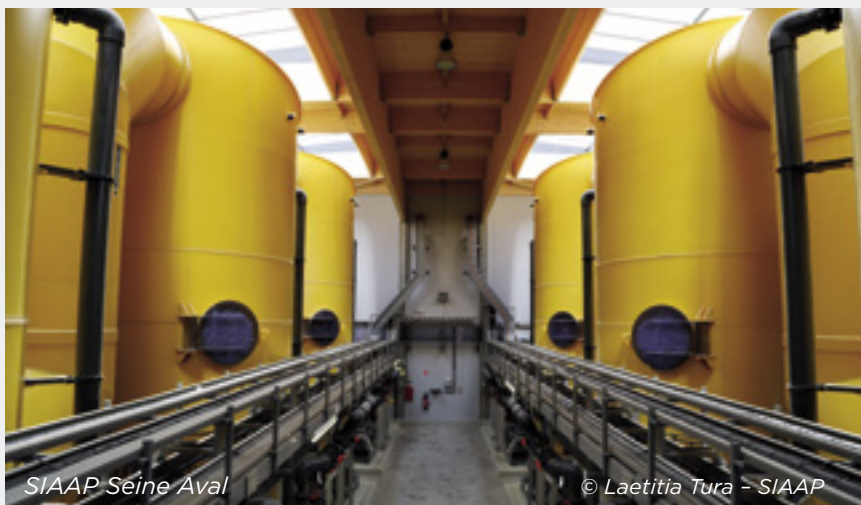
SIAAP Seine Aval

Les eaux usées ne peuvent être rejetées en l'état dans la nature car elles sont de nature à contaminer les milieux. On pense aux matières organiques bien sûr, mais aussi aux produits chimiques que nous utilisons comme les produits d'entretien, les lessives... Ces eaux doivent donc être « nettoyées » pour prévenir les risques de pollution.