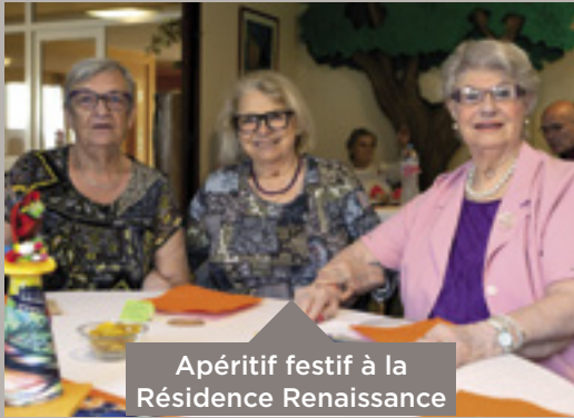
Apéritif festif à la Résidence Renaissance