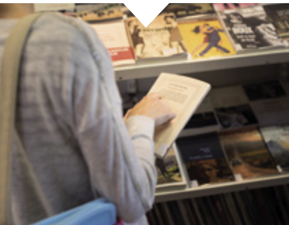
Bibliothèque La Jonchère / Elysée 1