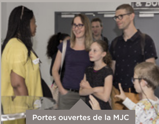
Portes ouvertes de la MJC