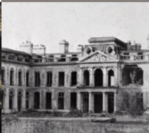
Il était une fois La Celle Saint-Cloud