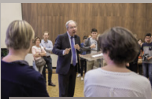
Réception des nouveaux bacheliers