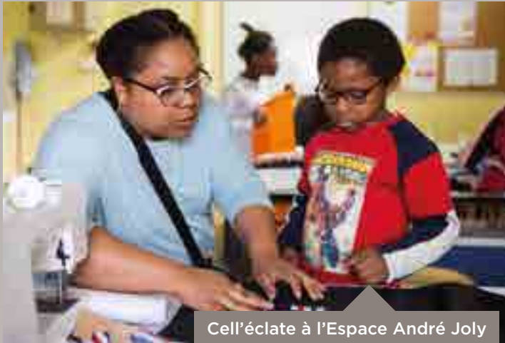
Cell'éclate à l'Espace André Joly