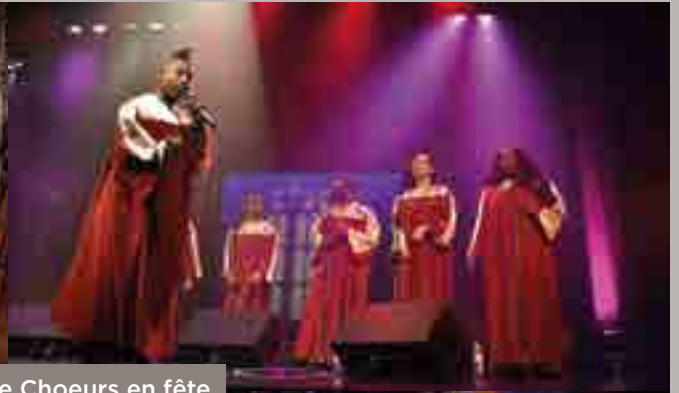
2 ème édition de Choeurs en fête