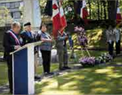
Commémoration du 8 mai 1945