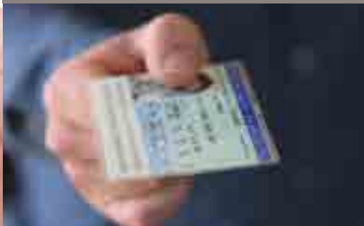
Vérifier la validité de vos titres d'identité