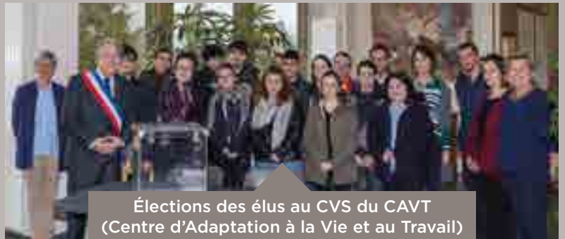
Élections des élus au CVS du CAVT (Centre d'Adaptation à la Vie et au Travail)