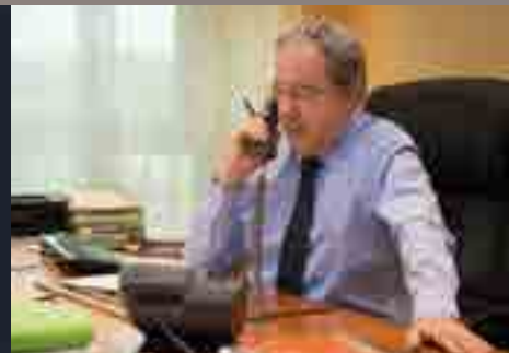
Allo Mr le Maire : mardis de 16h à 20h