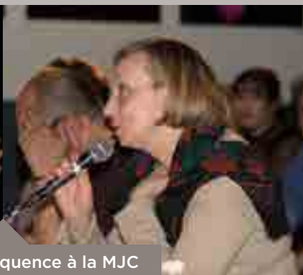
Concours d'éloquence à la MJC