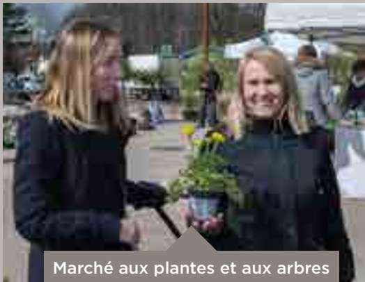
Marché aux plantes et aux arbres