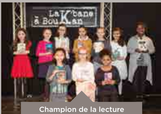
Champion de la lecture