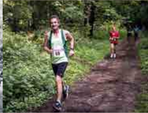
Courses en fête