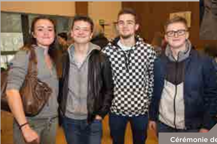
Cérémonie de la citoyenneté