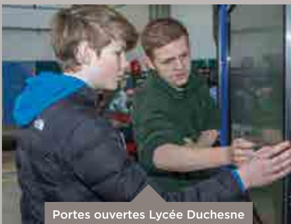
Portes ouvertes Lycée Duchesne