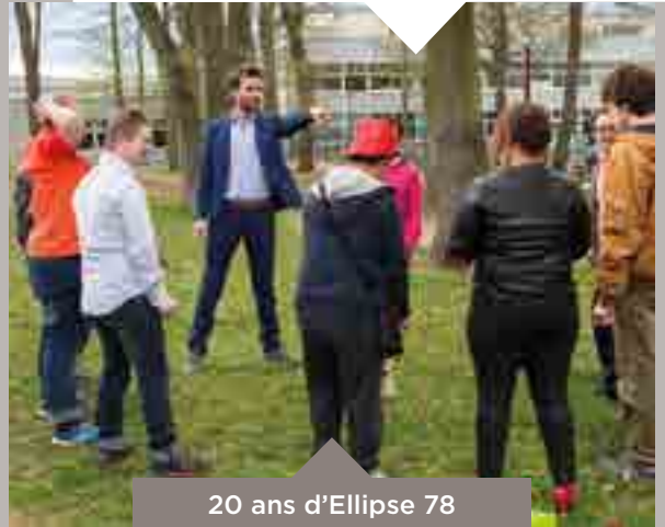
20 ans d'Ellipse 78