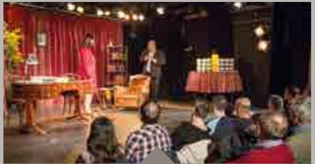
« Nous ne sommes pas du même monde » à la MJC