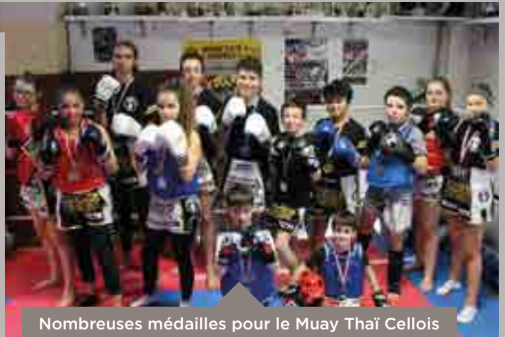
Nombreuses médailles pour le Muay Thaï Cellois