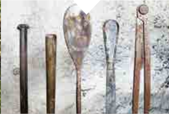
Exposition « Colonne »