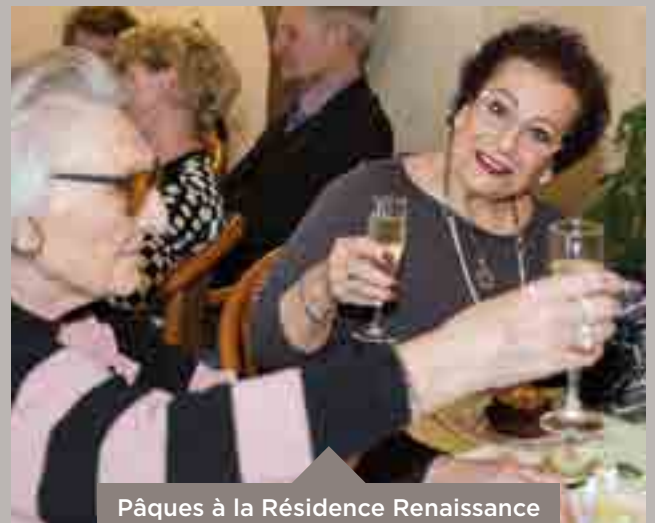
Pâques à la Résidence Renaissance