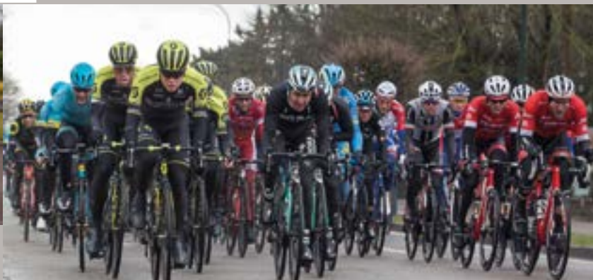
Etape de la course cycliste Paris-Nice à La Celle Saint-Cloud