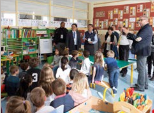
Visite d'une délégation taïwanaise à l'école Morel de Vindé