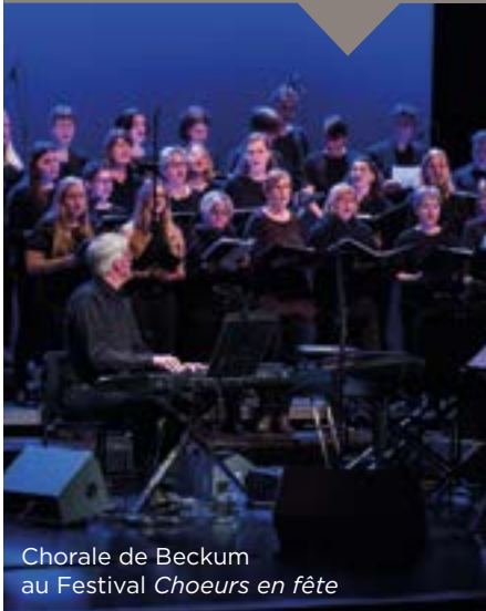
Chorale de Beckum au Festival Choeurs en fête