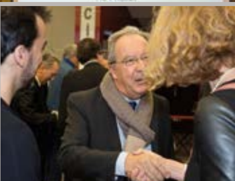
20 ans de l'association Salveterra