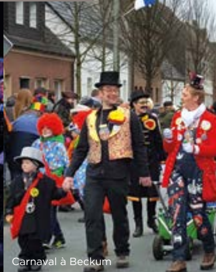
Carnaval à Beckum