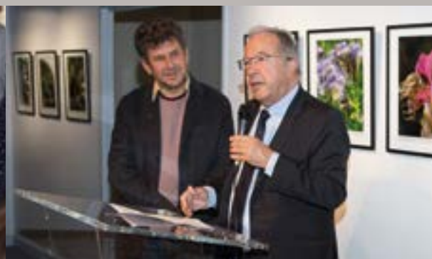
Vernissage de l'exposition Le génie des abeilles