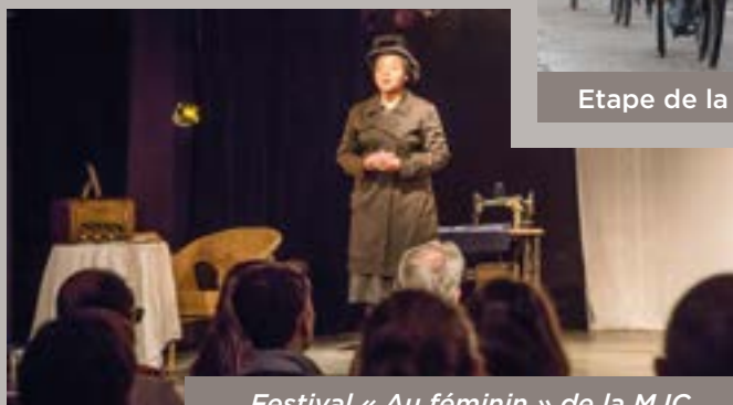
Festival « Au féminin » de la MJC