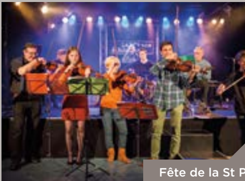
Fête de la St Patrick à la MJC