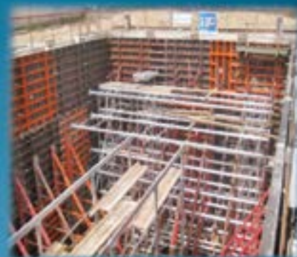
SARTROUVILLE - Rue des Eaux Bassin de stockage >2 000m 3