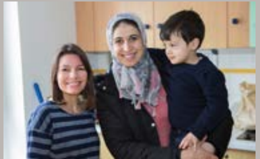
Grande Semaine de la Petite enfance : Des moments de partage et de plaisirs entre professionnels, parents et enfants