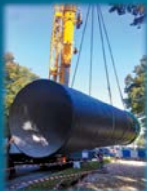
Réalisation d'un bassin de stockage des eaux Avenue du Château à MEUDON Fonte diamètre 2000 sur 250 mètres linéaires

Tél : 01 39 69 73 70 - 06 70 05 81 17 • entreprise.cherreauetfils@gmail.com