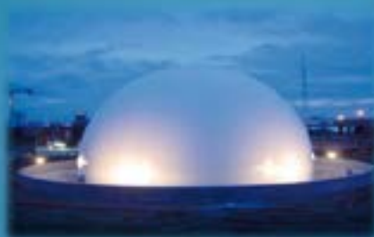
SIAAP Valenton - Gazomètre 4 000 m 3 Travaux de Génie Civil en zone confinée et ATEX