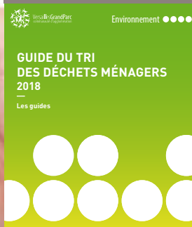
Guide du Tri