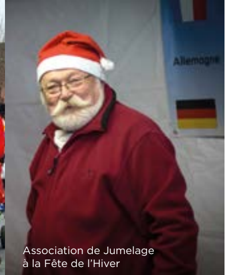
Association de Jumelage à la Fête de l'Hiver