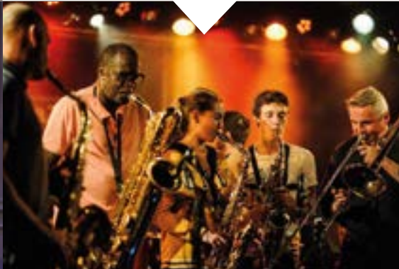
Jam Session à la MJC