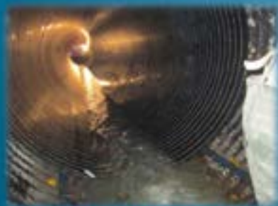
Le PECQ - Tubage de la huse ARMCO Diamètre 3 250 m sur 200 m

Travaux de voirie, réseaux divers Travaux d'assainissement Travaux de génie civil hydraulique D'étanchement, d'injection Et de réhabilitation d'ouvrages maçonnés visitables