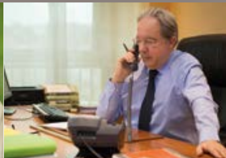
Allo M. le Maire : mardis de 16h à 20h