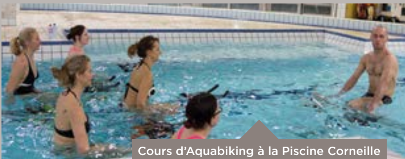
Cours d'Aquabiking à la Piscine Corneille