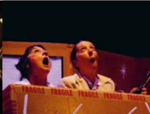
Le Pays Toutencarton