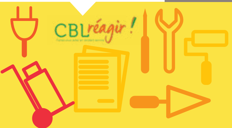
CBL Réagir !