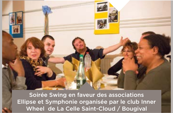
Soirée Swing en faveur des associations Ellipse et Symphonie organisée par le club Inner Wheel de La Celle Saint-Cloud / Bougival