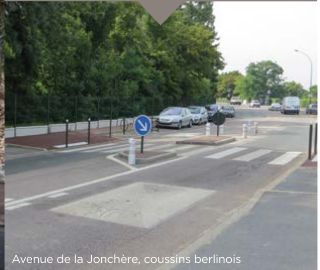
Avenue de la Jonchère, coussins berlinois