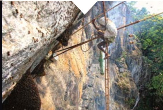
Exposition « Le génie des abeilles » d'Eric Tourneret