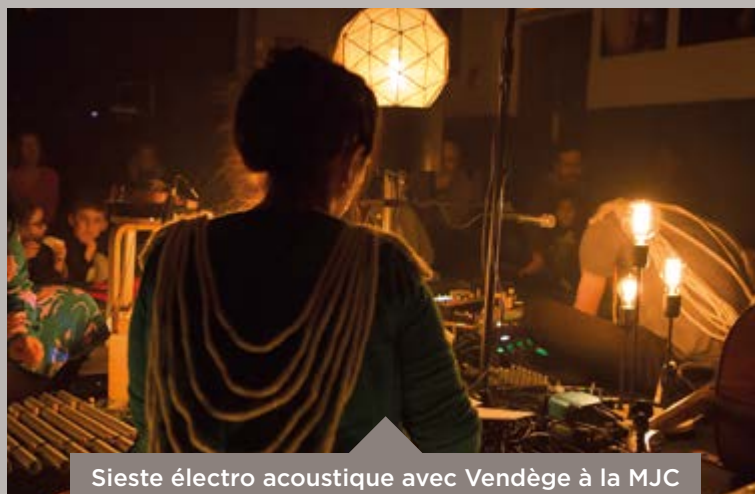
Sieste électro acoustique avec Vendège à la MJC