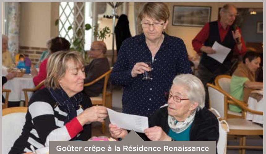
Goûter crêpe à la Résidence Renaissance