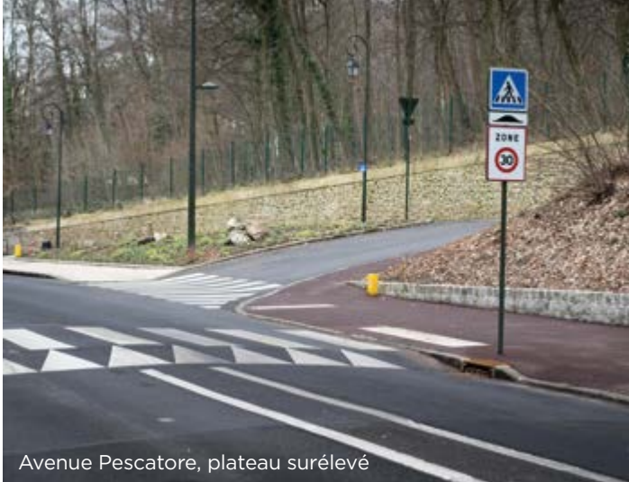
Avenue Pescatore, plateau surélevé