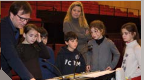
Atelier découverte du Théâtre avec les élèves des écoles élémentaires