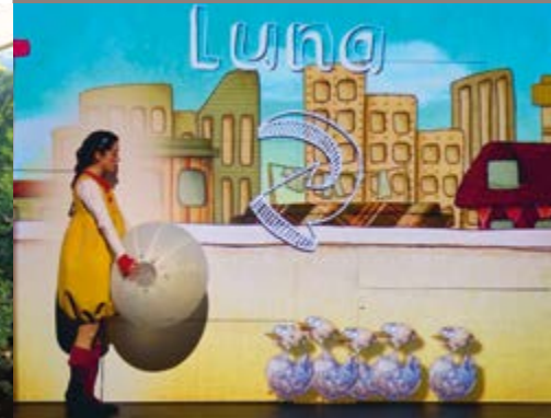
Tara sur la lune