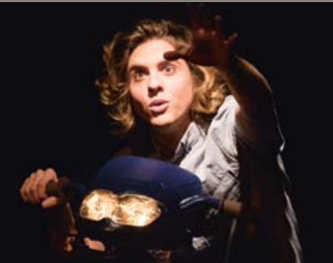
Venise n'est pas en Italie