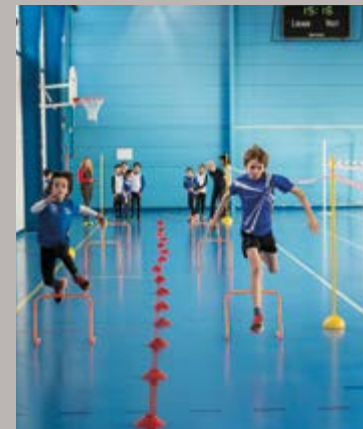
Championnat d'athlétisme au COSEC