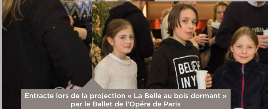
Entracte lors de la projection « La Belle au bois dormant » par le Ballet de l'Opéra de Paris