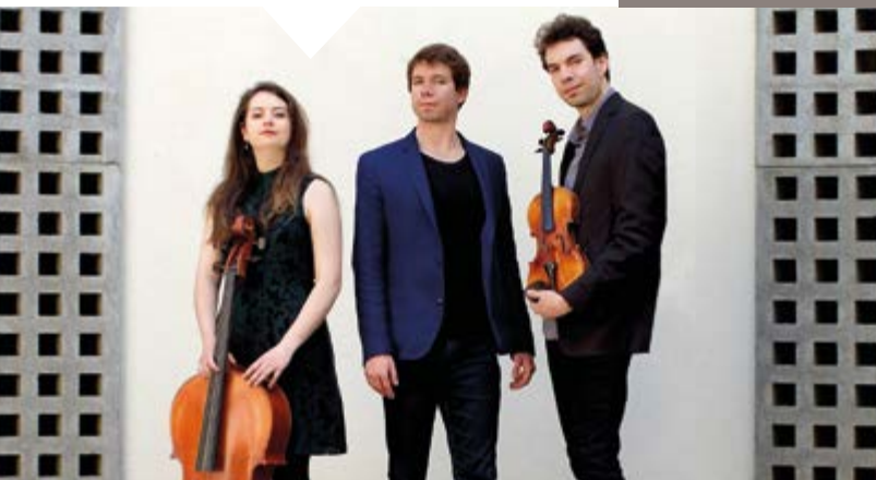
Concert Trio Métral par Accords solidaires