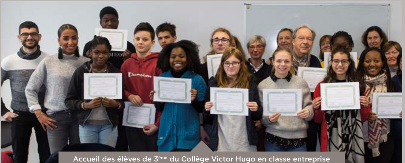
Accueil des élèves de 3 ème du Collège Victor Hugo en classe entreprise