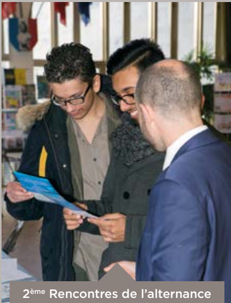
2 ème Rencontres de l'alternance