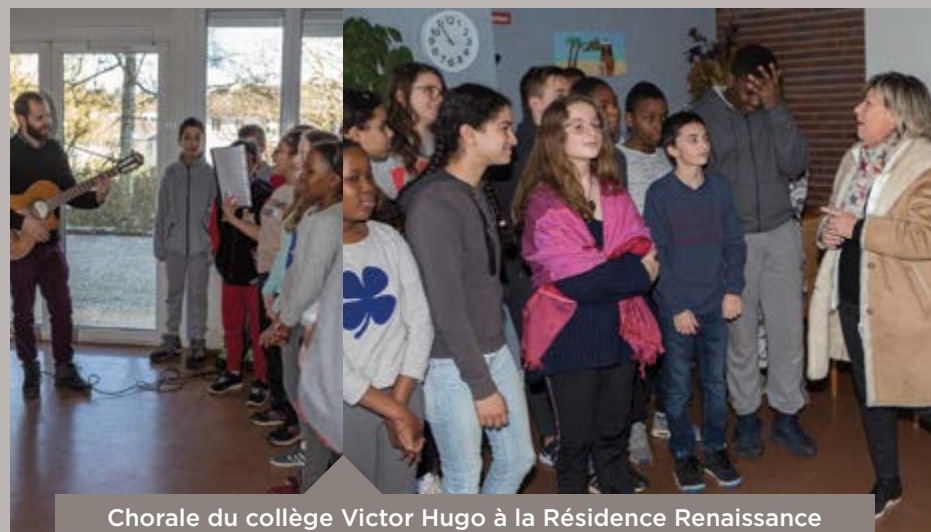
Chorale du collège Victor Hugo à la Résidence Renaissance