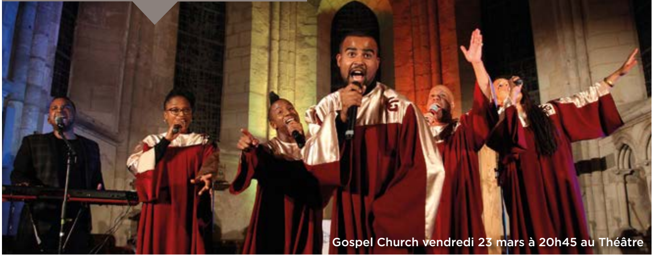
Gospel Church vendredi 23 mars à 20h45 au Théâtre